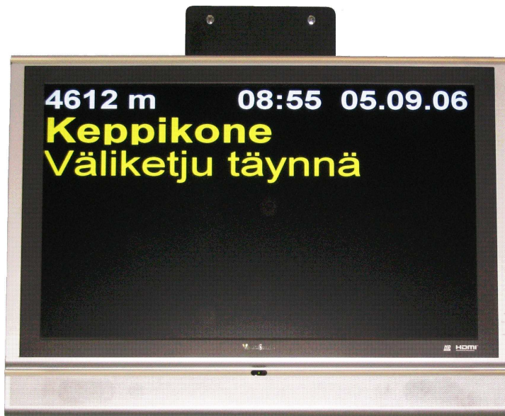
ApexInfo soveltuu lähes kaikkiin yleiskäyttöisiin PC-valvomoihin esim. WinCC, WinCC Flexible, InTouch, Citect ja MicroSCADA.

Kaksisuuntainen lukualue voidaan luoda asettamalla kaksi näyttöä selät vastakkain. Asettamalla 3-4 näyttöä selät vastakkain saadaan 360° lukualue. Samaan järjestelmään voidaan liittää useita ApexInfo-näyttöjä, 1-4 kutakin kommunikointi PC:tä kohti.